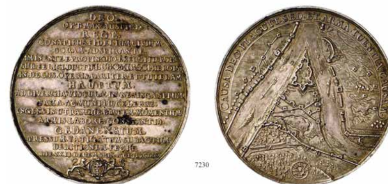
Il. 6. Medal pamiątkowy autorstwa Jana Höhna młodszego wybity z okazji zdobycia z rąk szwedzkich Gdańskiej Głowy, (źródło: F. R. Künker, Auktion 145).