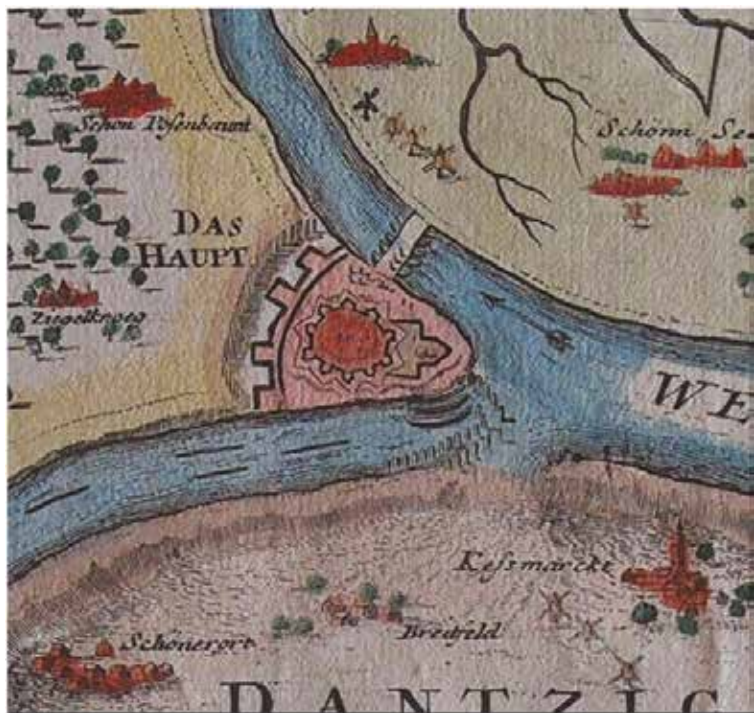
Il. 4. Fragment planu twierdzy Gdańska Głowa ukazujący przebite przez Szwedów w lutym roku 1657 wały w okolicy Kiesmarku i zalanie Żuław.