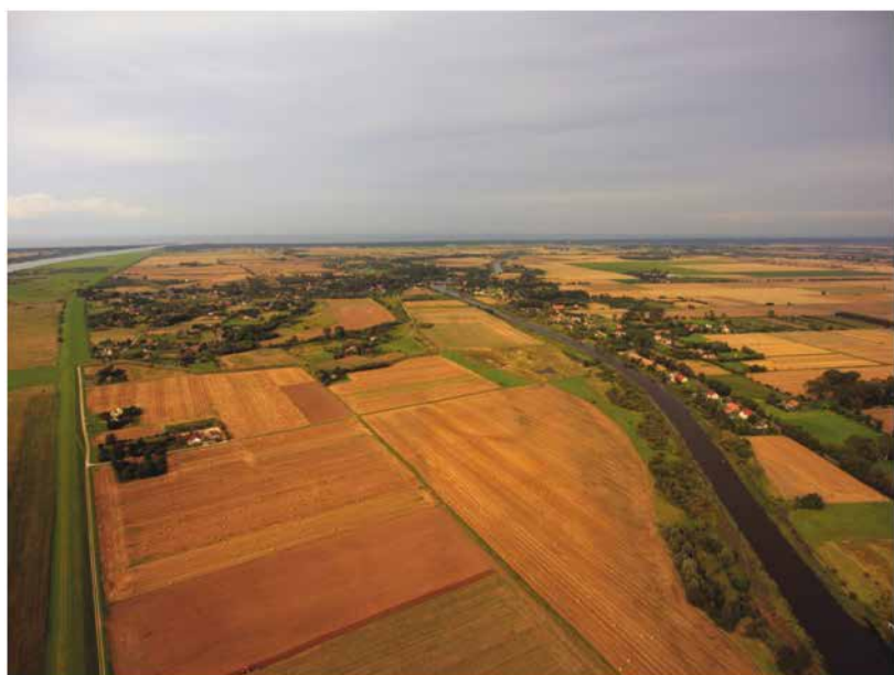
Il. 8. Obszar na którym znajdowała się niegdyś twierdza Gdańska Głowa. W tle widać zabudowania wsi Drewnica i Żuławki (za rzeką Szczepawa), (Fot.: Patryk Muntowski).