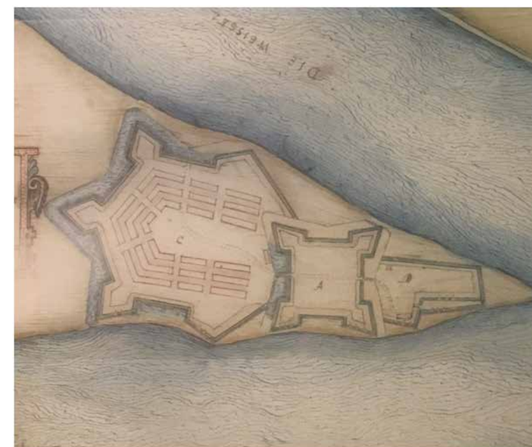
Il. 2. Fragment planu twierdzy Gdańska Głowa, Heinrich Thome, 1627. (źródło: K. Łopatecki, W. Walczak, Mapy i plany Rzeczypospolitej XVII w. znajdujące się w archiwaliach w Sztokholmie , T. 1, Warszawa 2011, s. 224).