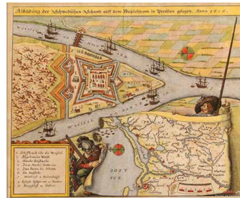
Il. 1. Plan Twierdzy Głowa koło Gdańska, Mattheus Merian, ok. 1640.