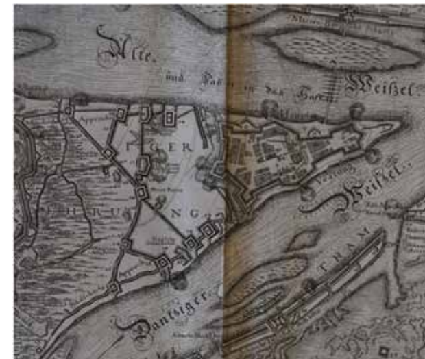
Il. 5. Fragment planu Strackwitza Twierdzy Gdańska Głowa z 1659 r., (źródło: Biblioteka Gdańska Polskiej Akademii Nauk).