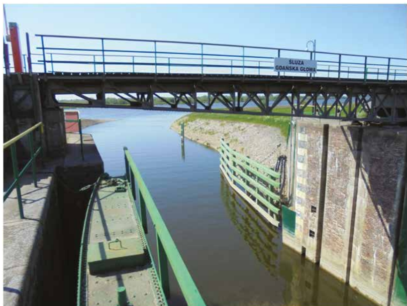
Il. 7. Śluza Gdańska Głowa, (Fot.: Radosław Kubus).